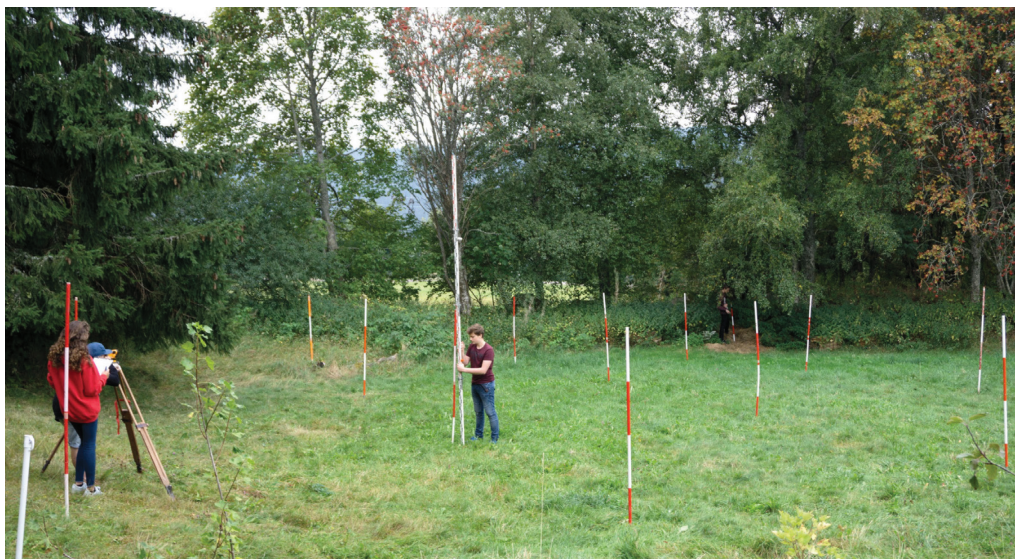
Abbildung 47: Gruppe V beim Vermessen des Höhenrasters

Alle Gruppen hatten bisher drei Messtätigkeiten durchgeführt: Messen der Längen, der Winkel und der Höhen. Einer Gruppe fehlte noch das Höhenmessen (Gruppe VI). Gruppe IV hatte lediglich Winkel gemessen und schon mit den Orthogonalaufnahme begonnen. An diesem Tag sollte nun hauptsächlich die Kleinvermessung stattfinden und zwar am Vormittag zunächst mithilfe der Orthogonalaufnahme. Um die Lage etwas zu entspannen, bekam Gruppe II den Auftrag, im unteren Polygon-