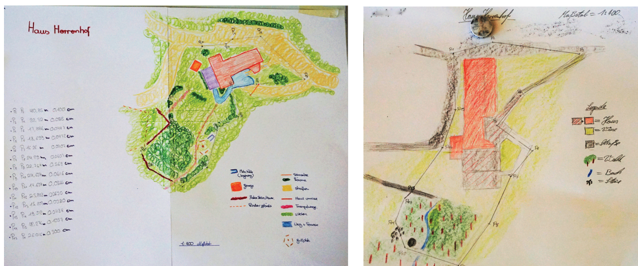
Abbildung 32: Erste Karten aus den Schrittmaßen und den geschätzten Winkeln

Auch jetzt wird wieder mit großer Ernsthaftigkeit und Ruhe gezeichnet. Vielfach wird Hilfe von mir erbeten, besonders in den Fällen, wenn sich der Polygonzug nicht schließt. Mit etwas exakter Phantasie lassen sich alle Züge schließen und allen sieht man die Erleichterung an, denn teilweise musste oft radiert und verbessert werden. Abschließend wird in das Polygongerüst die Landschaft eingezeichnet. So ist eine erste Karte entstanden.